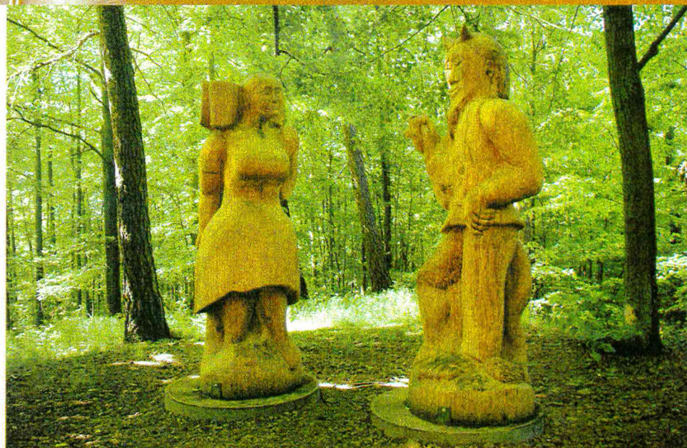
↑ Čert a Káča na vrcholu Tanečku

V mnoha směrech vzdělaný, společenský Josef Hlávka je považován za největšího českého mecenáše, i když stejně jako Dvořák psal lépe německy, než česky. Inu, žili přece