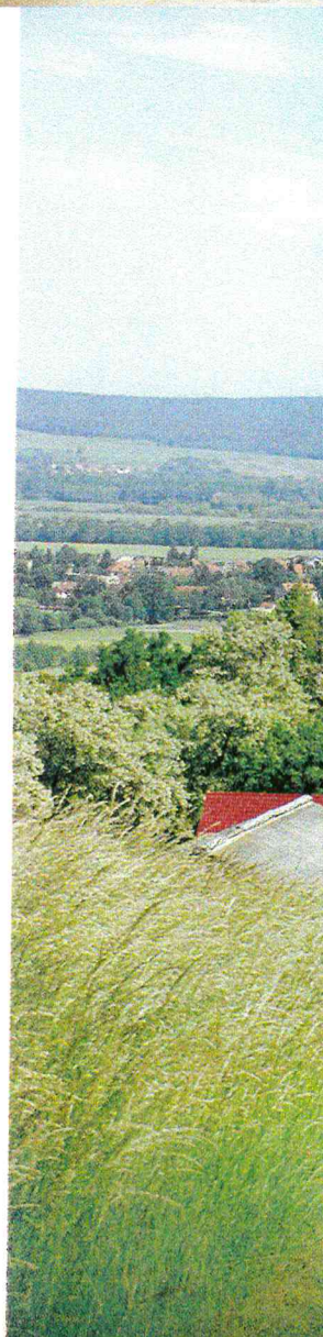
↓ Zámek architekta Hlávky v Lužanech

V roce 1866 koupil v Lužanech architekt Josef Hlávka (1831–1908), rodák z nedalekých Přeštic, zámek. Údajně pro svou maminku za to, že jej podporovala v jeho posedlosti stát se stavitelem. Sen se mu splnil, v oboru zazářil už coby mladík – v devětadvaceti obdržel zakázku na projekt rezidenčního areálu řecko-pravoslavné církve v Černovicích na Bukovině (dnes západní Ukrajina, tehdy součást Rakousko-Uherska, mimochodem – tento Hlávkův areál byl v roce 2011 zapsán na listinu světového kulturního a přírodního dědictví UNESCO). Rok na to zahájil stavbu proslulé Dvorní opery ve Vídni, začal pracovat na projektu pražské Zemské porodnice a další zakázky se jen jen hrnuly. Jenže stres a dlouhé pracovní cesty po Evropě se podepsaly na Hlávkově zdraví. Na podzim 1869 zkolaboval, ochrнул na obě nohy, skončil na invalidním vozíku a stáhl se do ústraní – do Lužan. Když se kolem roku 1880 začal znovu stavět na nohy, zbývaly jeho první ženě Marii pouhé dva roky života. Marie byla jeho studentskou láskou, jako manželé prožili krásných dvacet let, než podlehla tuberkulóze. Smutný vdovec pak opustil lužanskou samotu, vrátil se do Prahy k práci a štěstí mu za čas zase ukázalo svou tvář.