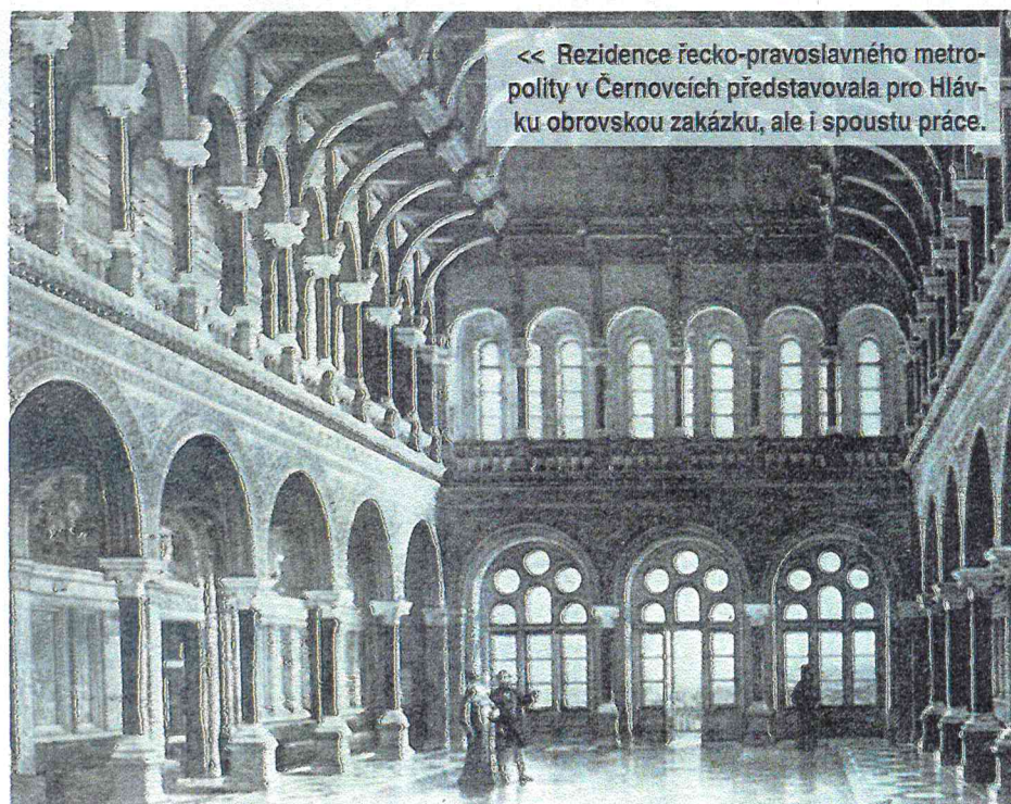
<< Rezidence řecko-pravoslavného metropolitů v Černovicích představovala pro Hlávku obrovskou zakázku, ale i spoustu práce.

Hlávka se snažil, aby se k jeho darům připojili nejen další občané, ale i různé instituce, obce a stát. Zkrátka provokoval možné přispěvatele. Příkladem je jeho dar 15 000 zlatých na postavení sochy sv. Václava s podmínkou, že zbytek dokončí zemský výbor. Nejvyšší zemský maršálek Jiří