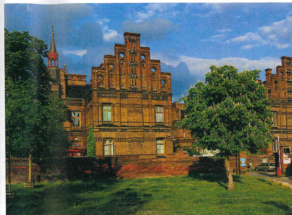
Zemská porodnice v Praze začala sloužit roku 1875. Ve své době byla velmi moderní. V průběhu stavby Hlávka částečně ochrnul a stavbu řídil na dálku – z Lužan...

Josef Hlávka byl dnešním jazykem řečeno workoholik. Léta dozoroval všechny své stavby, často cestoval, zúčastňoval se architektonických soutěží... A stres se projevil už v jeho 38 letech, kdy zkolaboval z vyčerpání. Ochrnul na nohy a pohyboval se pouze na invalidním vozíku, přesto dál pracoval. Když ale začal ztrácet i zrak, musel se vzdát své kanceláře a odstěhoval se na zámek Lužany u Přeštic, který před časem koupil pro svou matku.