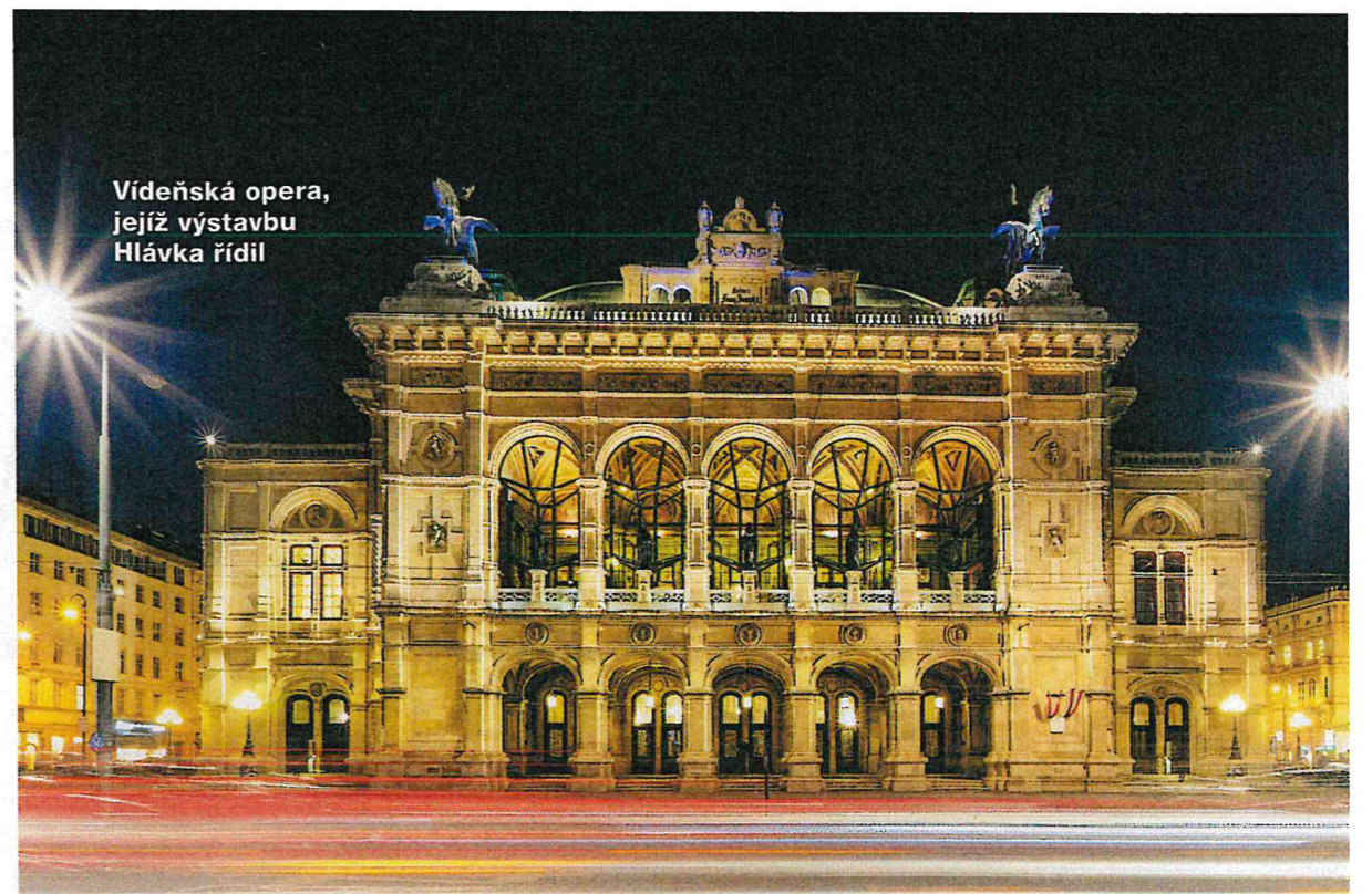
Vídeňská opera, jejíž výstavbu Hlávka řídil