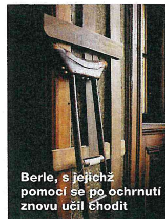
Berle, s jejichž pomocí se po ochrnutí znovu učil chodit