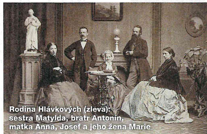
Rodina Hlávkových (zleva): sestra Matylda, bratr Antonín, matka Anna, Josef a jeho žena Marie