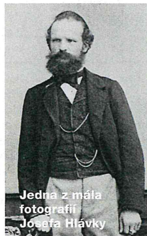
Jedna z mála fotografií Josefa Hlávky