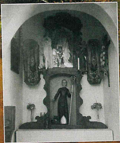
Interiér kapličky z kroniky obce 1929