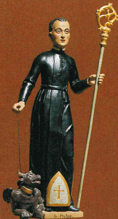
Soška sv. Prokopa z inventáře Domu historie Přešticka

Panně Marii „Zázračné“ projevovaly úctu také místní ženy v šestinedělí přinášením másla do lamp s věčným světlem.