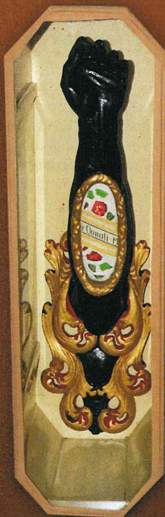
Barokní relikvíř v podobě černé ruky v prosklené skříňce, Dům historie Přešticka.

Soška byla též zdobena pláštíkem, ten poslední získala v roce 1913 od sester z přeštického Ústavu Školských sester de Notre Dame. Byla o něj okradena tuláky na podzim roku 1918.