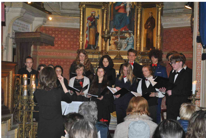
Mše D dur („Lužanská“)